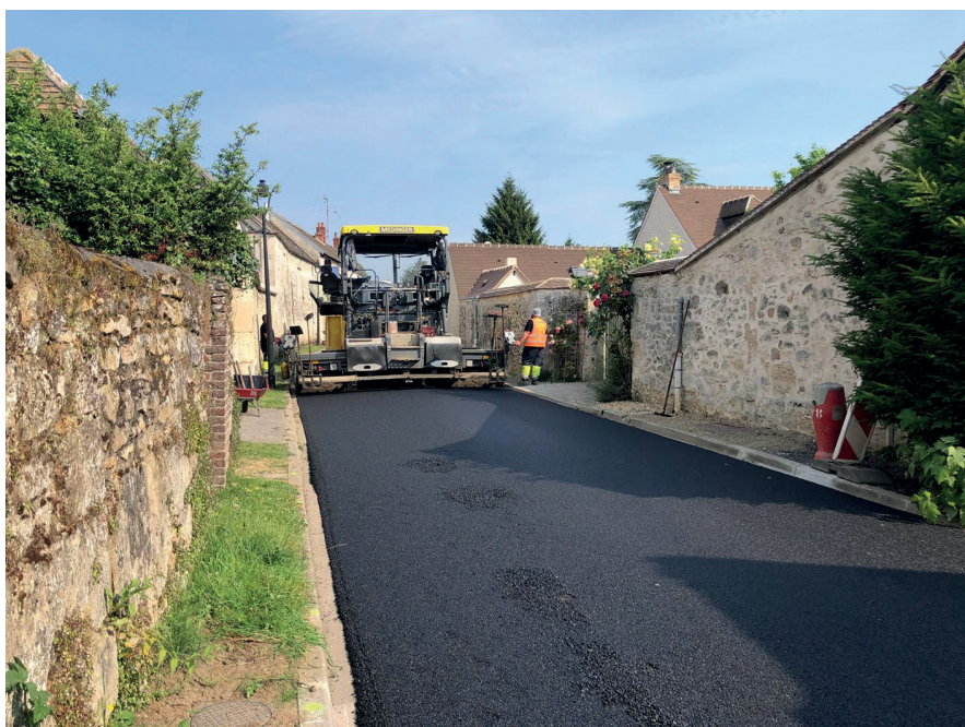
Réfection de la chaussée rue vieille de Pont à Villers-Saint-Frambourg-Ognon.