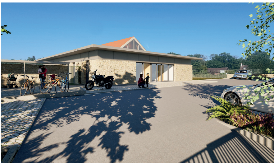
Une projection de la MAM.