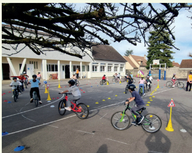
La CCSSO soutient une initiative pour la sécurité des enfants à vélo.

La CCSSO accompagne cette initiative permettant à plus de deux cents élèves de renforcer leur autonomie et de circuler en toute sécurité