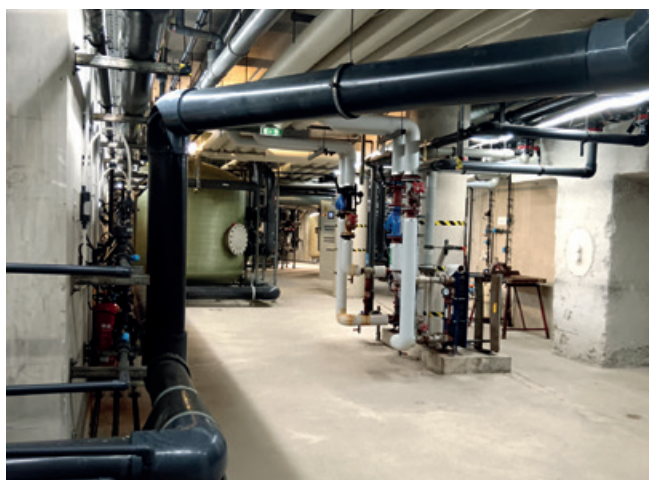
Des installations techniques performantes et écoresponsables.

Les discussions avec les candidats auront lieu à l'été 2025 pour une sélection finale en fin d'année. Les travaux débuteront début 2026 et s'étendront sur 18 à 24 mois. Durant cette période, la piscine Yves Carlier restera ouverte le plus longtemps possible pour continuer à accueillir le public.