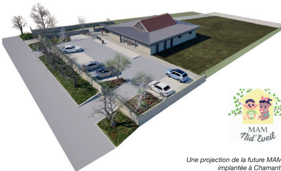
Une projection de la future MAM implantée à Chamant.

Pour toute information, vous pouvez contacter l'association Nid'Éveil : lamam.nideveil@gmail.com